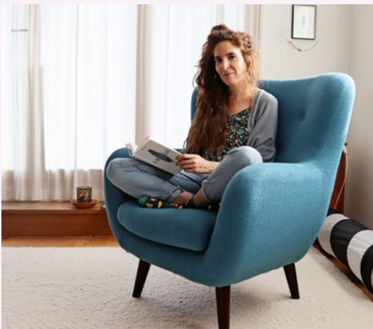
«Lauralei» wurde zum Erfolg – der Roman ist bereits in der dritten Auflage erschienen.

Doch nachdem sie sich erste Reise-träume erfüllt hatte – unter anderem eine Zugreise in die Mongolei – nahm ihre berufliche Laufbahn eine unerwartete Wendung. «Eine Berufsberaterin zeigte mir ein Porträt